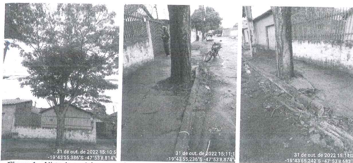
Figura 1 – Vista do espécime, com destaque para as raízes expostas e danos na calçada.

No momento da vistoria, foi possível verificar que o espécime, de grande porte, apresenta raízes expostas e elevação da calçada, comprometendo a acessibilidade e a estrutura do muro do imóvel. Além disso, possui ramos epicórmicos que se caracterizam pela fraca ligação com o tronco, constituindo fator de risco. Vale ressaltar também o conflito com a rede elétrica.